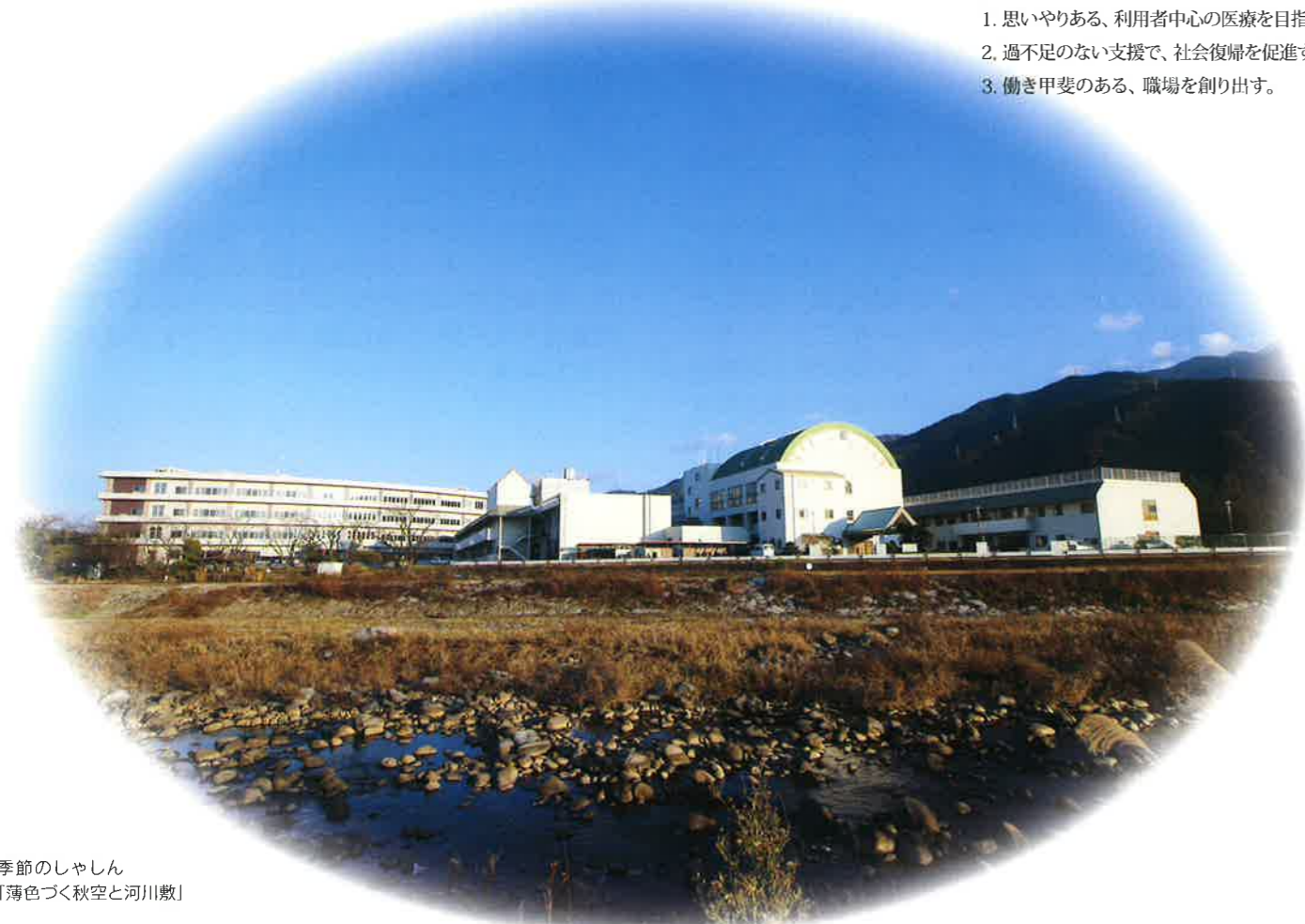
季節のしやしん 「薄色づく秋空と河川敷」